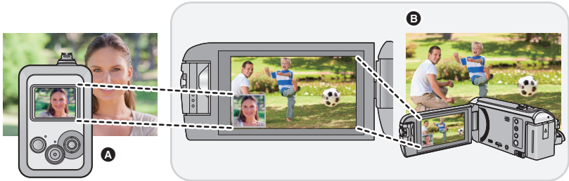
A 본 기기 (무선 서브 카메라)

본 기기와 비디오 카메라 (메인 카메라)를 Wi-Fi를 통해 연결하면 메인 카메라의 서브 윈도우 상에 본 기기에서 전송된 이미지를 표시할 수 있으며 주 카메라의 이미지와 동시에 촬영할 수 있습니다. (무선 트윈 카메라)