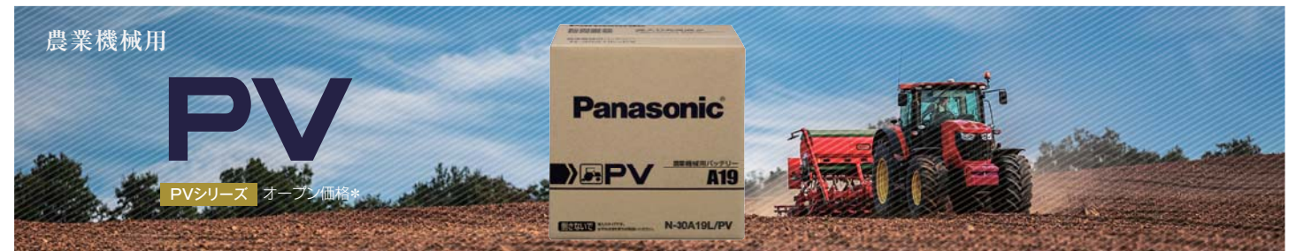
□ピービー 要項表 PVシリーズ 6サイズ 11品番 オープン価格*