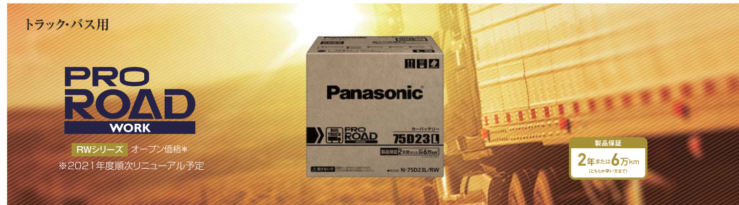
□プロロードワーク 要項表 RWシリーズ 2サイズ 4品番 オープン価格*