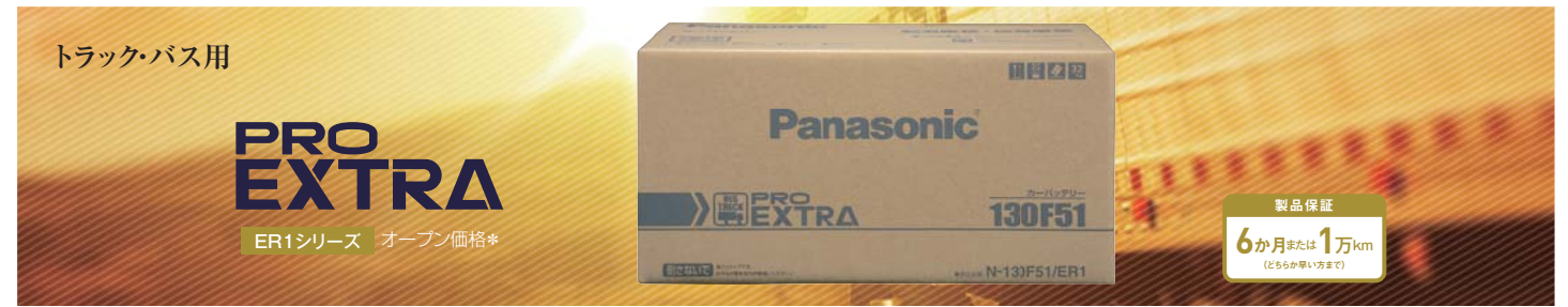
□プロエクストラ 要項表 ER1シリーズ 1サイズ 1品番 オープン価格*

*) オープン価格商品の価格は販売店にお問い合わせください。※写真や画像はイメージです。実際とは異なる場合があります。