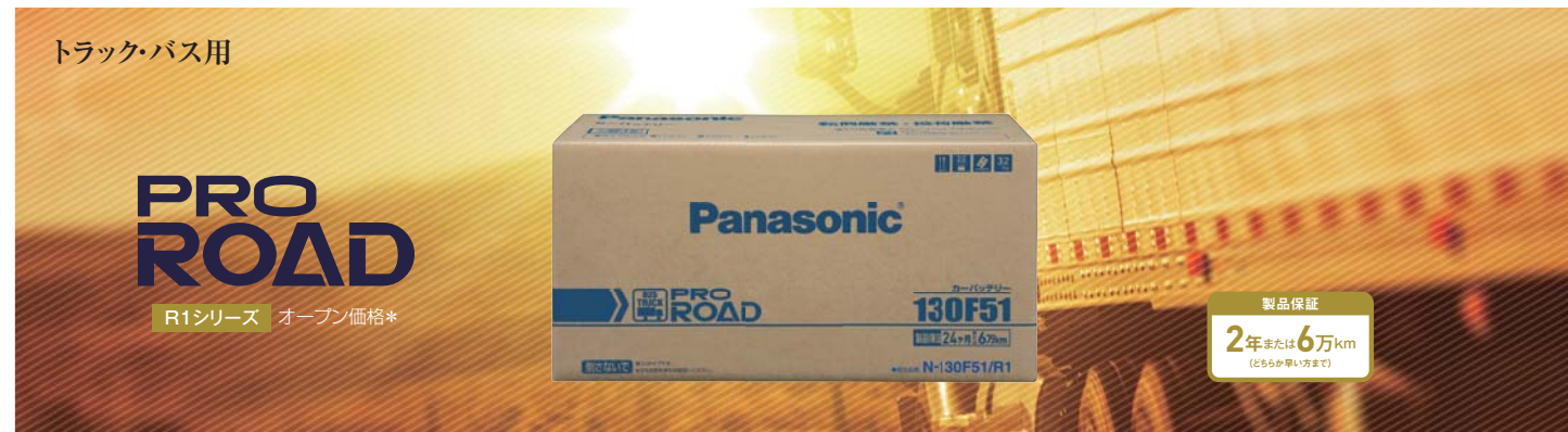
□プロロード 要項表 R1シリーズ 5サイズ 14品番 オープン価格*