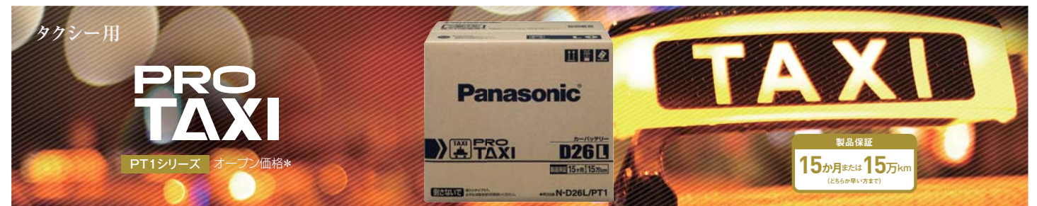
□プロタクシー 要項表 PT1シリーズ 1サイズ 2品番 オープン価格*