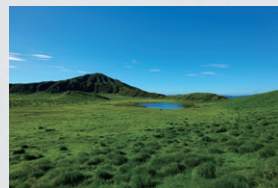
SS1IX, S 18-40 F4.5-6.3 / 18mm, 1/400sec, F5.6, ISO100