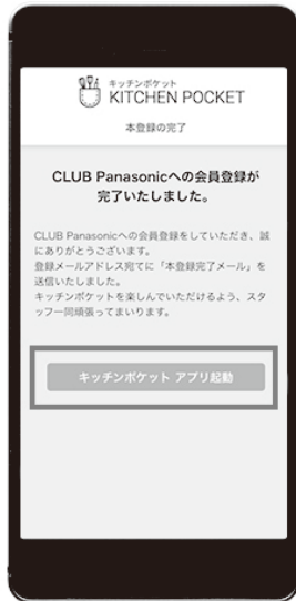
① キッチンポケットアプリ起動を押す