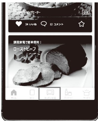
① ホーム画面下部の「キッチン家電」を押す

「キッチン家電」から IH クッキングヒーターを登録し、キッチンポケットアプリ ※1 で使えるようにします。