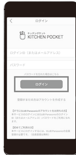
② 画面に従って CLUB Panasonic の ID とパスワードでキッチンポケットアプリ ※1 にログインする